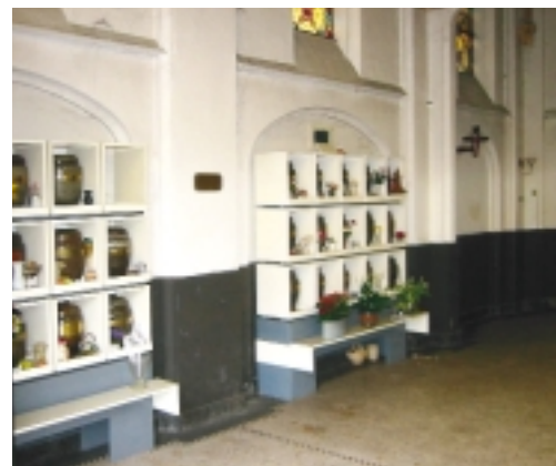
Urnenbewaarplaats in de kapel van de Rooms-katholieke Begraafplaats in Sneek: het antwoord op de vraag 'Wat te doen met waardevolle gebouwen die buiten gebruik zijn gesteld?'